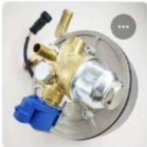
PEGASUS LPG REGULATOR