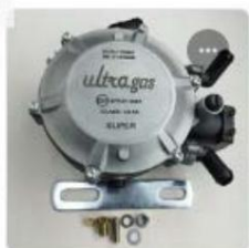
ORION-L1-SUPER-PL LPG REGULATOR