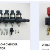
APOLLO 4 CYLINDER INJECTOR