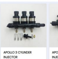
APOLLO 3 CYLINDER INJECTOR