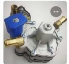
Monza X LPG REGULATOR

Injectors Ultragas Injectors иҷрои аълобоку шоданва пушидани зу д дар фишорҳои тағйирё бале таъминменамоя д. он в ашлав андагии инфиродӣ ва васлку нии амалӣ ва зу ди сопоҳои инжектор ҳангоми табдилдиҳӣ бартариҳои назаррас пешкаш меку нанд. Ху су сия ти тозаку нӣ нигоҳдории дарозму ддати сармоя гу зории шу моро таъминмеку нанд. Онбокафлати 100,000 кммея д .