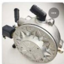
ORION L2 LPG REGULATOR