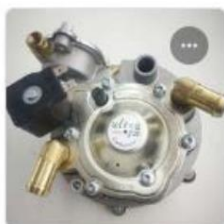
DRACO T1 LPG REGULATOR

Истифода: Оқодар мошинҳои сӯзандору и я к ну қта, боқонвертерҳои каталитикӣ му чаҳҳаз ва карбюратор истифода мешаванд . Фишори максималии даромад: 45 бар Фишори танвими марҳилаи аввал: 0,6 бар Қу в ва и катрон 14 в атт