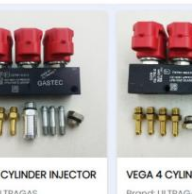
VEGA 3 CYLINDER INJECTOR Brand: ULTRAGAS