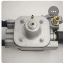
LIGER X LPG REGULATOR