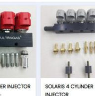
VEGA 4 CYLINDER INJECTOR Brand: ULTRAGAS