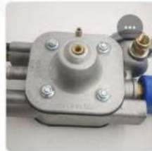
TIGER X LPG REGULATOR