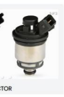
ASTRO SINGLE INJECTOR