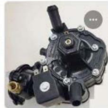
FOCUS X BLACK LPG REGULATOR