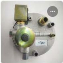
ARDA X LPG REGULATOR