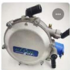
ORION L1 LPG REGULATOR